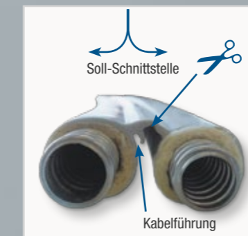
Einfache Trennung durch Soll-Schnittstelle möglich