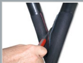
Vor- und Rücklauf leicht trennbar