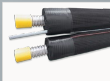
Kappen schützen bei Transport und Montage